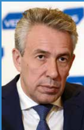
ГОРЬКОВ СЕРГЕЙ НИКОЛАЕВИЧ Председатель Внешэкономбанка